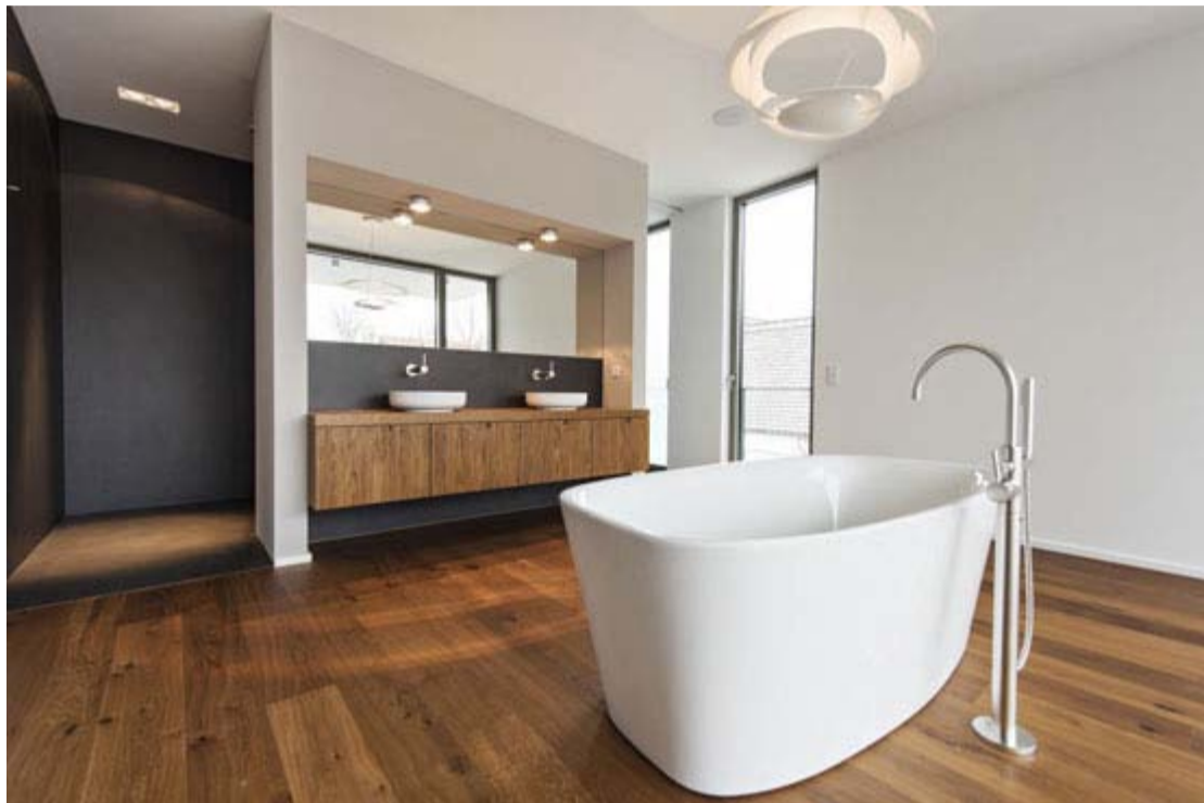
Foto: © Michael Onischke, DOMO Architektur, Photograph: Wilson Ortiz

Eine reduzierte Formensprache, die mit einem Minimum an Interieur auskommt. Klar und offen gestaltet und völlig barrierefrei. Im Fokus, der Material-Dreiklang – der durch die dunkle Keramikoberfläche der LAMINAM® Kollektion Blend Nero an der Rückwand vervollständigt wird. Nach intensiver Bemusterung entschieden sich die Bauherren für die ultradünne Großkeramik als drittes Material .